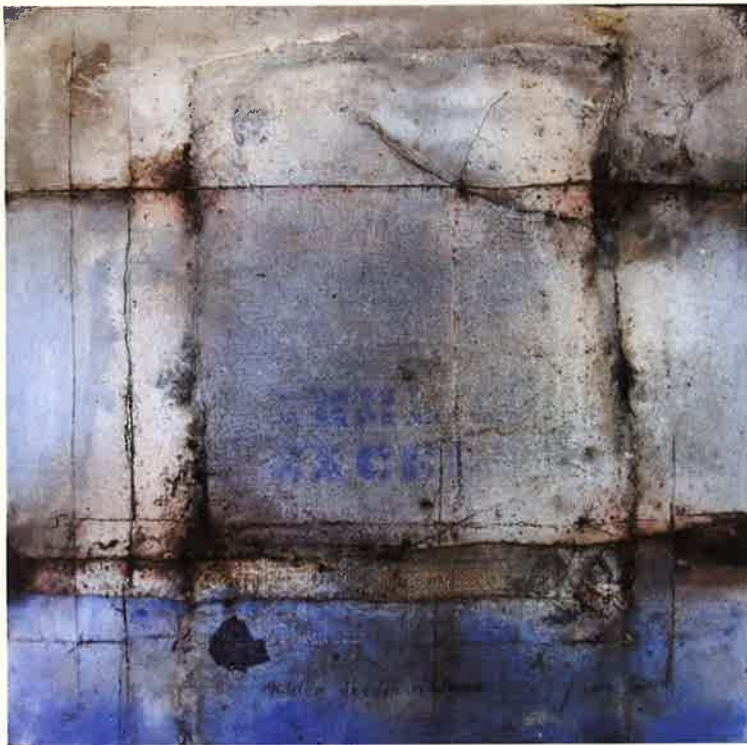
Achter draden in blauw