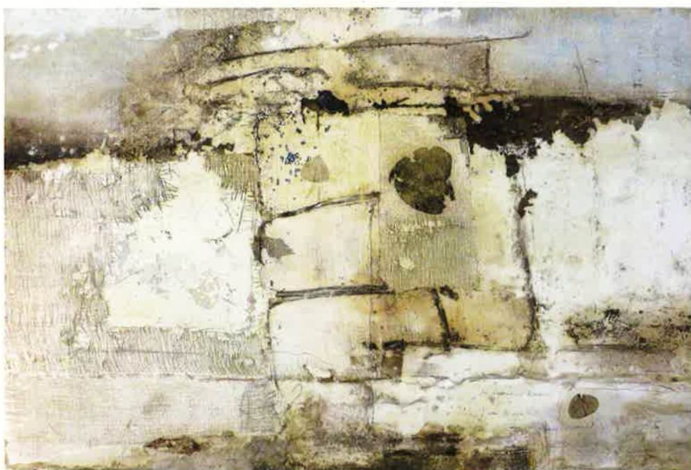
In perkament bezonken