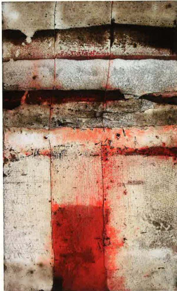
Altijd stralend stiltepunt

Ik exposeerde in oude vlas- en aardappelschuren en verwerk de indrukken die ik er opdeed in hetgeen ik maak. Het is ook de associatie met het aanbrengen en weer weghalen van verschillende lagen.